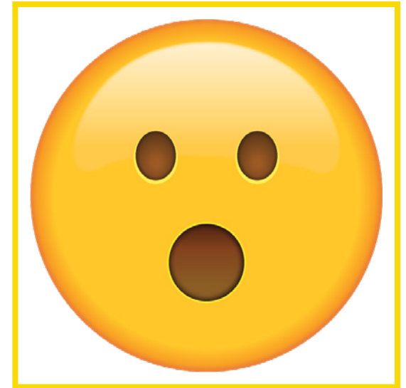
Surprised • Soprendido/a