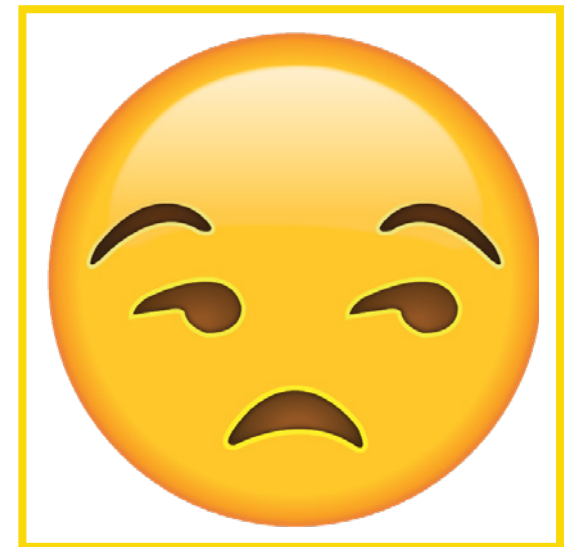
Bored • Aburrido/a