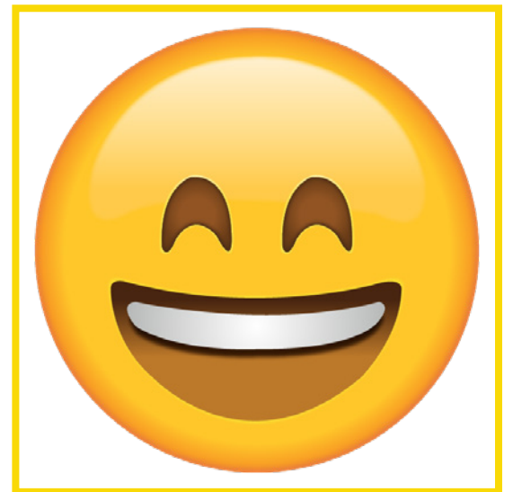
Excited • Emocionado/a