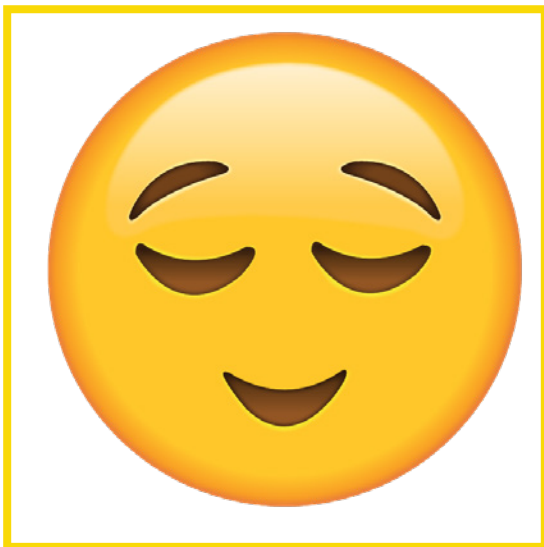
Shy • Tímido/a