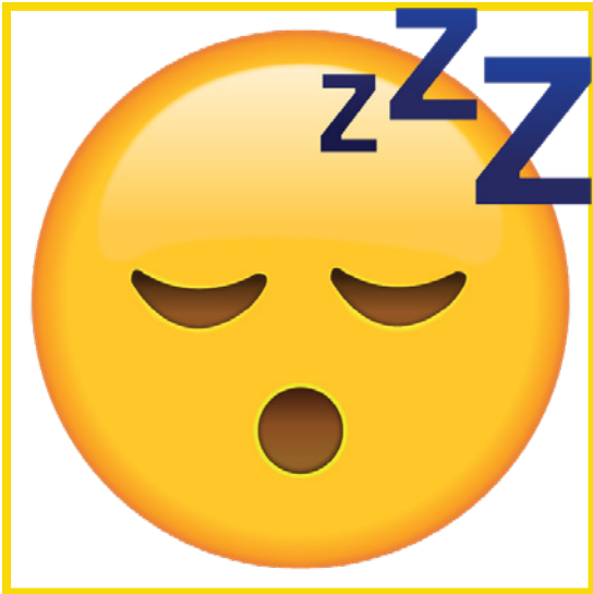
Tired • Cansado/a