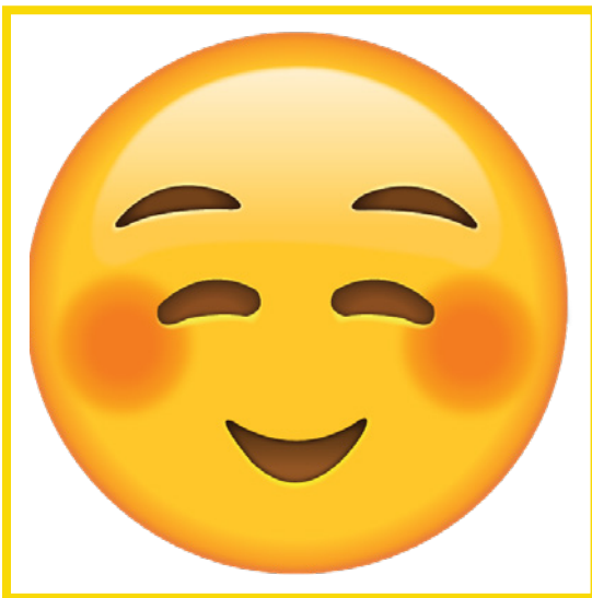
Embarrassed • Avergonzado/a