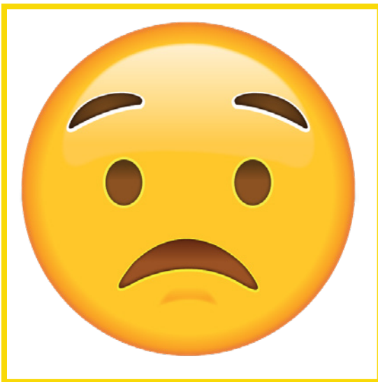
Worried • Perocupado/a