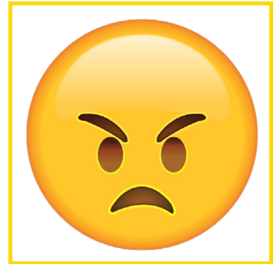
Angry • Enojado/a