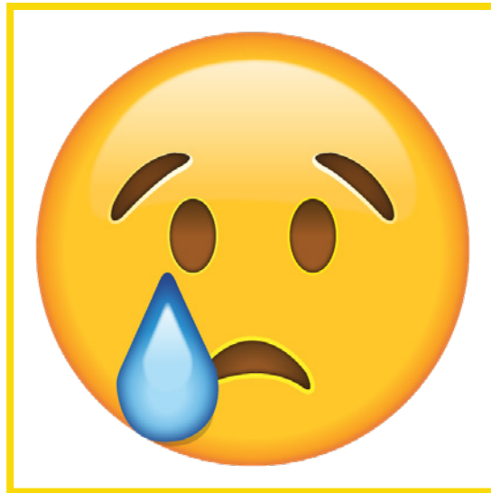
Sad • Triste